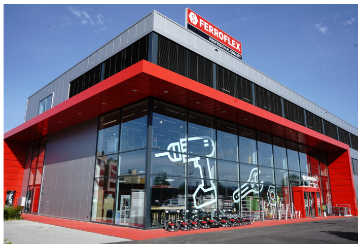
Le site d'Oberentfelden L'un des onze sites de FERROFLEX Group à travers la Suisse