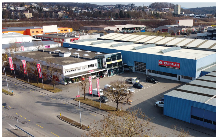
Le site de Schaffhouse L'un des onze sites de FERROFLEX Group à travers la Suisse