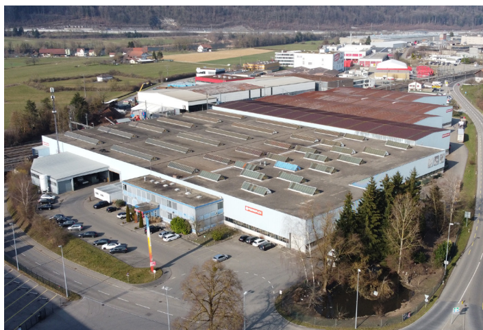
Le site de Rothrist L'un des onze sites de FERROFLEX Group à travers la Suisse